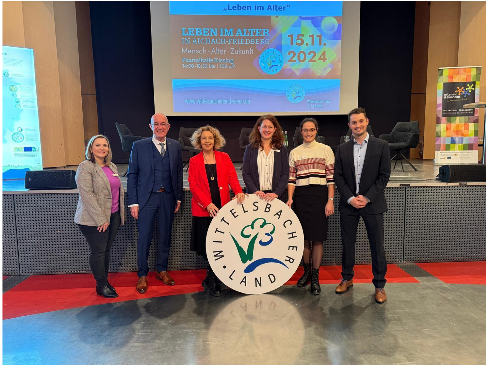
20241115 Veranstaltung "Leben im Alter" mit Schirmherrin Michaela May