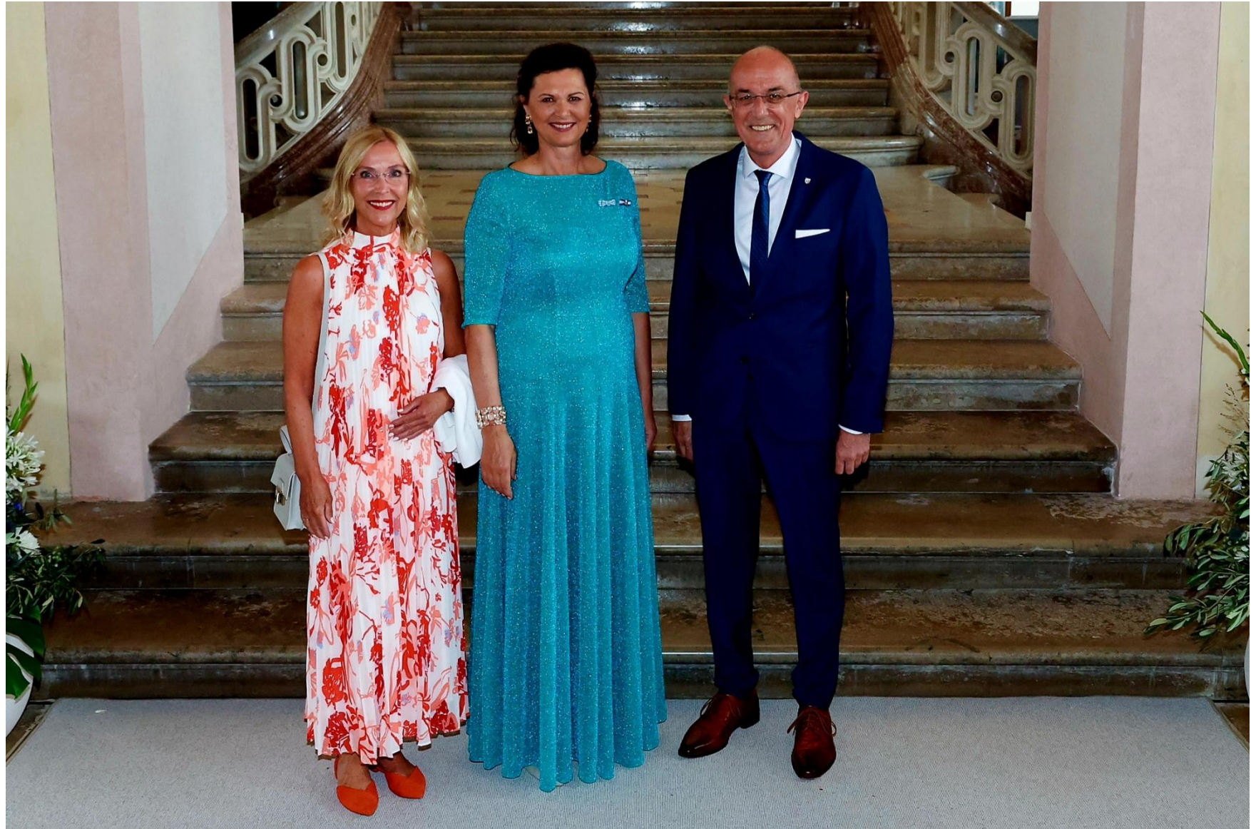
20240616 Sommerempfang des Bayerischen Landtags auf Schloss Schleißheim mit Frau Landtagspräsidentin Ilse Aigner/ 20240616 Summer reception of the Bavarian State Parliament at Schleißheim Palace with State Parliament President Ilse Aigner