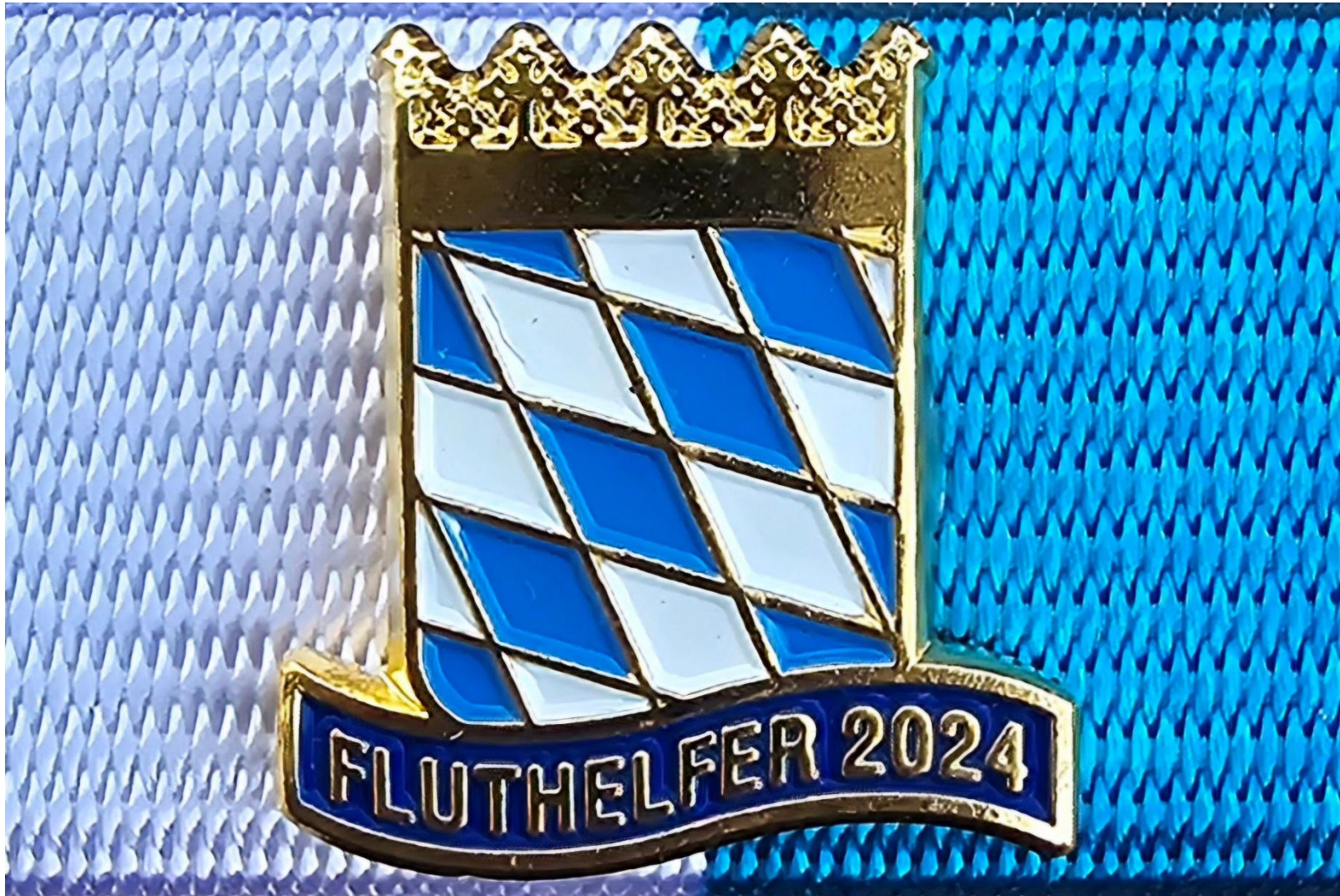
20240718 Empfang für die Fluthelfer auf Schloss Schleißheim 20240718 Reception for the flood relief workers at Schleißheim Palace